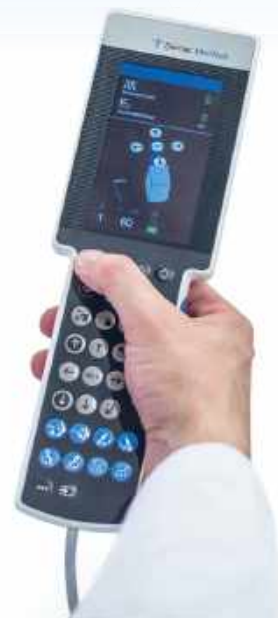
▲ Unified Hand Control